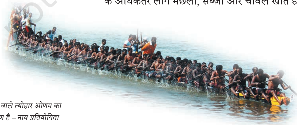
केरल में मनाए जाने वाले त्योहार ओणम का एक विशेष आकर्षण है – नाव प्रतियोगिता

चीन के व्यापारी भी केरल आए। यहाँ पर मछली पकड़ने के लिए जो जाल इस्तेमाल किए जाते हैं वे चीनी जालों से हू-ब-हू मिलते हैं और उन्हें 'चीना-वला' कहते हैं। तलने के लिए लोग जो बर्तन इस्तेमाल करते हैं उसे 'चीनाचट्टी' कहते हैं। इसमें 'चीन' शब्द इस बात की ओर इशारा करता है कि उसकी उत्पत्ति कहाँ हुई होगी। केरल की उपजाऊ ज़मीन और जलवायु चावल की खेती के लिए बहुत उपयुक्त है और वहाँ के अधिकतर लोग मछली, सब्जी और चावल खाते हैं।