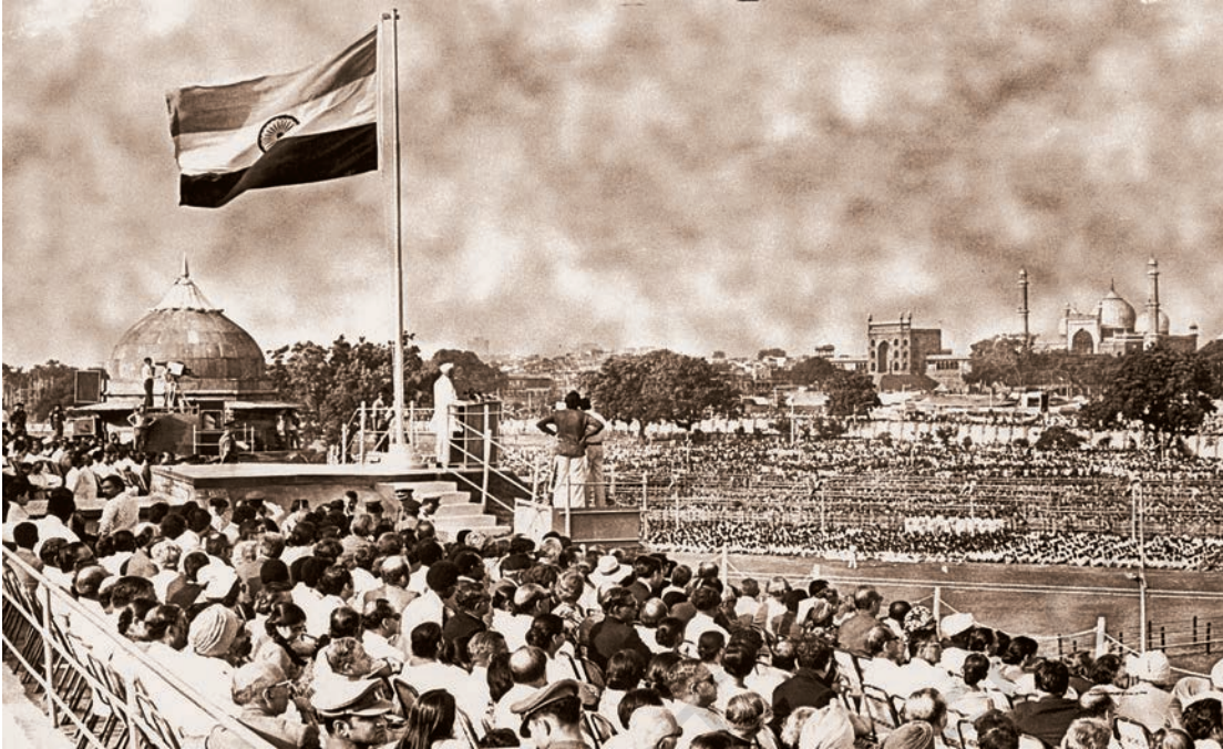
स्वतंत्रता दिवस के अवसर पर भाषण देते हुए पंडित नेहरू

यह गीत अमृतसर में हुए जलियाँवाला बाग हत्याकांड के बाद गाया जाता था। इस हत्याकांड में एक ब्रिटिश जनरल ने उन शांतिप्रिय, निहत्थे लोगों पर खुले आम गोलियाँ चलवा दी थीं जो बाग में इकट्ठे होकर सभा कर रहे थे। महिला-पुरुष, हिंदू-मुसलमान एवं सिख — कितने सारे लोग थे जो अंग्रेजों की पक्षपातपूर्ण नीति का विरोध करने के लिए जमा हुए थे। उसमें से बहुत लोगों की जानें गईं और उससे भी ज्यादा घायल हुए। यह गीत उन्हीं शहीदों की याद में गाया गया था।