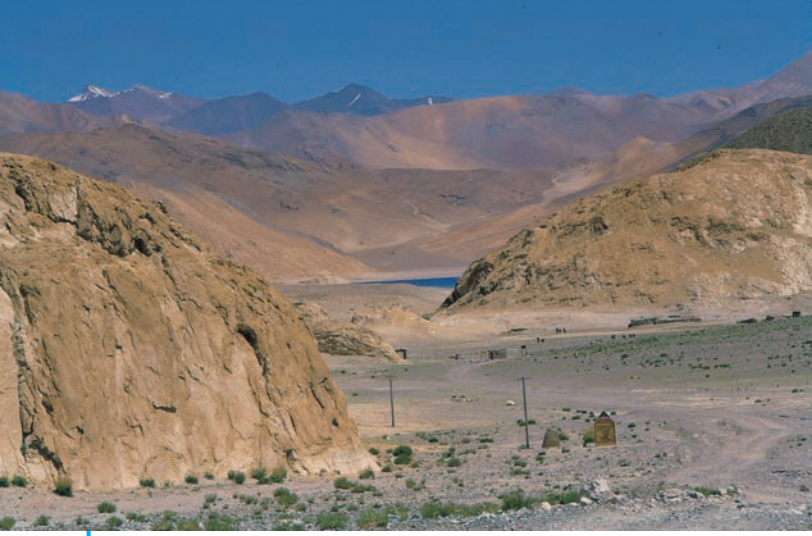
लद्दाख – ऊँचे पहाड़ों वाला रेगिस्तानी इलाका

लद्दाख जम्मू और कश्मीर के पूर्व में पहाड़ियों में बसा एक रेगिस्तानी इलाका है। यहाँ पर बहुत ही कम खेती संभव है, क्योंकि इस क्षेत्र में बारिश बिल्कुल नहीं होती और यह इलाका हर वर्ष काफी लंबे समय तक बर्फ से ढँका रहता है। इस क्षेत्र में बहुत ही कम पेड़ उग पाते हैं। पीने के पानी के लिए लोग गर्मी के महीनों में पिघलने वाली बर्फ पर निर्भर रहते हैं।