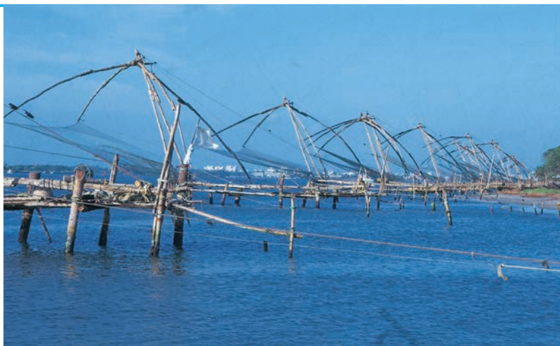
मछली पकड़ने का चीनी जाल

सबसे पहले अरबी एवं यहूदी व्यापारी केरल आए। ऐसा माना जाता है कि ईसा मसीह के धर्मदूत संत थॉमस लगभग दो हजार साल पहले यहाँ आए। भारत में ईसाई धर्म लाने का श्रेय उन्हीं को जाता है। अरब से कई व्यापारी यहाँ आकर बस गए। इब्न बतूता ने, जो करीब सात सौ साल पहले यहाँ आए, अपने यात्र वृत्तांत में मुसलमानों के जीवन का विवरण देते हुए लिखा है कि मुसलमान समुदाय की यहाँ बड़ी इज्जत थी।