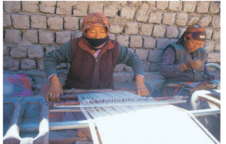
पश्मीना शाल बुनती हुई औरतें

लद्दाख के रास्ते ही बौद्ध धर्म तिब्बत पहुँचा। लद्दाख को छोटा तिब्बत भी कहते हैं। करीब चार सौ साल पहले यहाँ पर लोगों का इस्लाम धर्म से परिचय हुआ और अब यहाँ अच्छी-खासी संख्या में मुसलमान रहते हैं। लद्दाख में गानों और कविताओं का बहुत ही समृद्ध मौखिक संग्रह है। तिब्बत का ग्रंथ केसर सागा लद्दाख में काफी प्रचलित है। उसके स्थानीय रूप को मुसलमान और बौद्ध दोनों ही लोग गाते हैं और उस पर नाटक खेलते हैं।